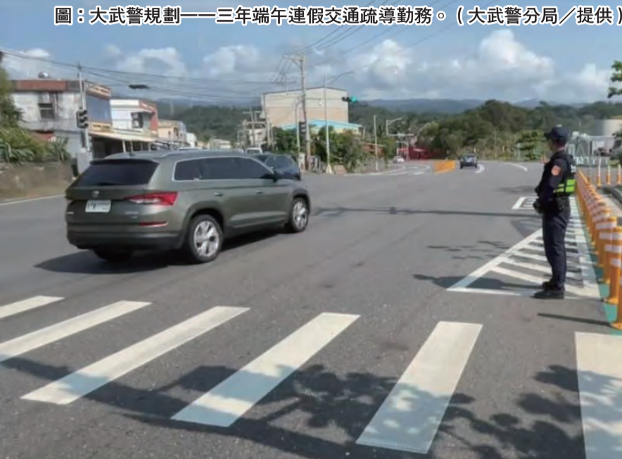
圖：大武警規劃——三年端午連假交通疏導勤務。