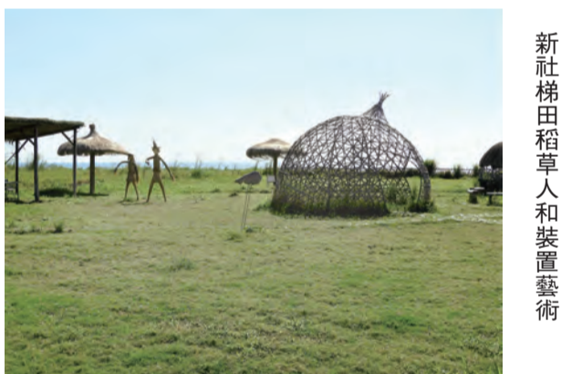
新社梯田稻草人和裝置藝術