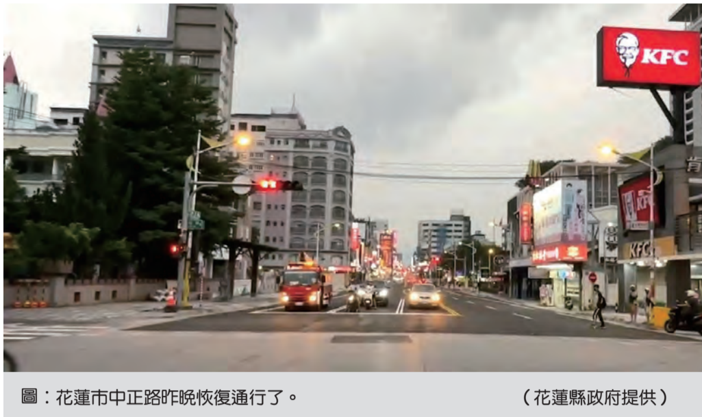
圖：花蓮市中正路昨晚恢復通行了。

吉安麥當勞段重鋪道路 麥當勞於五月底預定時間內完成拆除作業，之後開始清運土方、廢棄物、刨除路面、重鋪道路，畫設道路標線及恢復周邊公共設施，可望最快今天恢復通行。 規畫警方加強疏導交通，以降低交通衝擊。