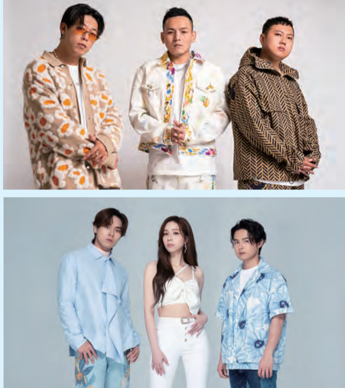
2024東石海之夏活動將於7月底連續兩個週末在嘉義東石漁人碼頭登場，玖壹壹(上)與「告五人」(下)等藝人歌手應邀演出。