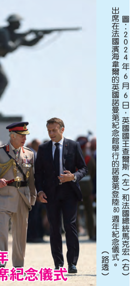
圖：2024年6月6日，英國國王查爾斯(左)和法國總統馬克宏(右)出席在法國濱海韋爾的英國諾曼第紀念館舉行的諾曼第登陸80週年紀念儀式。