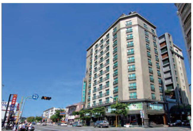
圖：花蓮藍天麗池飯店一館已消失在地平線。(資料照片)

記者田德財/報導 封閉已久的花蓮市中正路藍天麗池飯店路段，六日下午六點半恢復通行，吉安鄉中華路台雄商業大樓麥當勞路段預計最快今天可以通行。