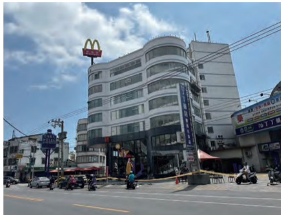
圖：吉安台雄商業大樓一二樓麥當勞夷為平地。(資料照片)