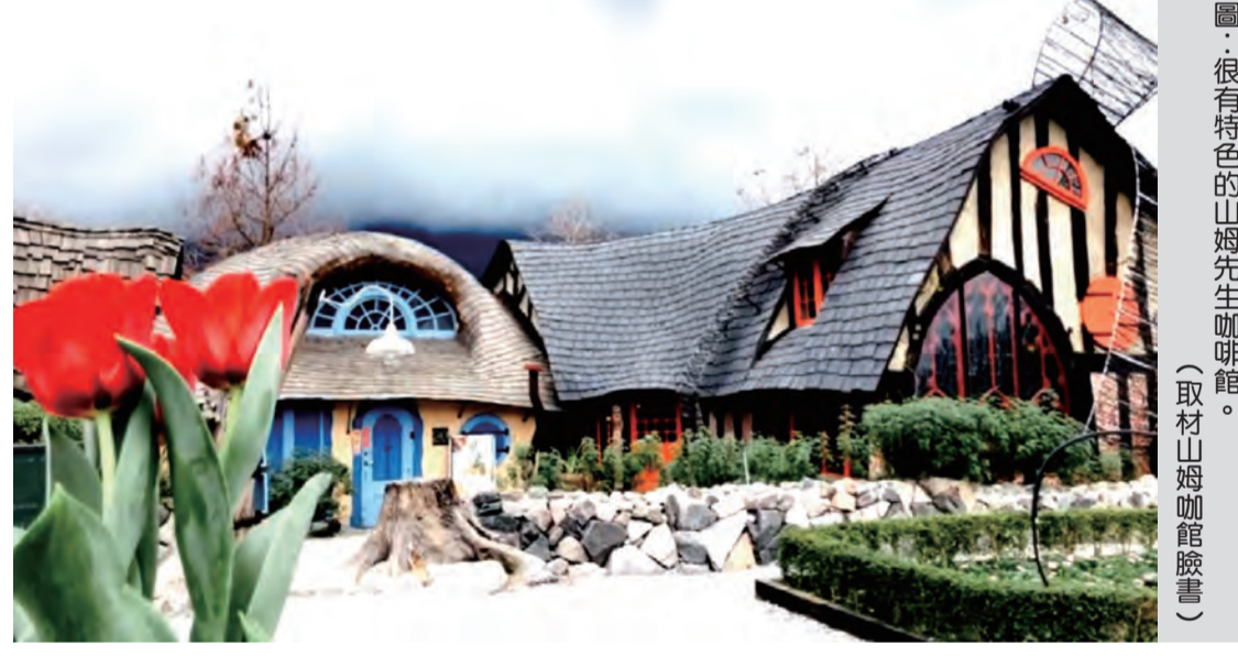
圖：很有特色的山姆先生咖啡館。

記者田德財/報導 2018年開幕的Mr. Sam山姆先生咖啡館，五日貼出暫停營業訊息說：休息是為了走更長遠的路，我們要暫時跟大家說再見了，因地震關係影響實在太嚴重了，苦撐兩個月之後還是不敵現實。 山姆先生咖啡館主要提供咖啡、冰沙及輕食為主，甜點有厚片吐司、巴斯克乳酪蛋糕、馬卡龍等等，有時還吃得克到肉肉飯、泡菜豬飯等，但並非每天都提供。 山姆先生咖啡館位於花蓮縣壽豐鄉，看起來像三間屋子連在一起，三種顏色、尺吋的瓦片以生動的弧形覆蓋在屋頂上，一磚一瓦都是店家自己動手堆疊的，建築的結構看起來特別生動，黑紅配色的小屋還綁上蝴蝶結，可愛又夢幻。園區湖畔種滿唯美落羽杉，彷彿來到歐洲莊園。 山姆先生咖啡館位於花蓮縣壽豐鄉，看起來像三間屋子連在一起，三種顏色、尺吋的瓦片以生動的弧形覆蓋在屋頂上，一磚一瓦都是店家自己動手堆疊的，建築的結構看起來特別生動，黑紅配色的小屋還綁上蝴蝶結，可愛又夢幻。園區湖畔種滿唯美落羽杉，彷彿來到歐洲莊園。 山姆先生咖啡館位於花蓮縣壽豐鄉，看起來像三間屋子連在一起，三種顏色、尺吋的瓦片以生動的弧形覆蓋在屋頂上，一磚一瓦都是店家自己動手堆疊的，建築的結構看起來特別生動，黑紅配色的小屋還綁上蝴蝶結，可愛又夢幻。園區湖畔種滿唯美落羽杉，彷彿來到歐洲莊園。