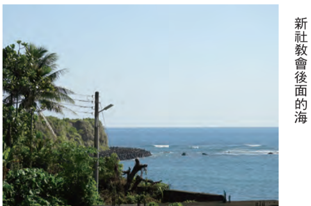
新社教會後面的海