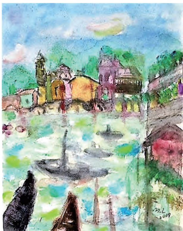
林明理畫作(春在花蓮)