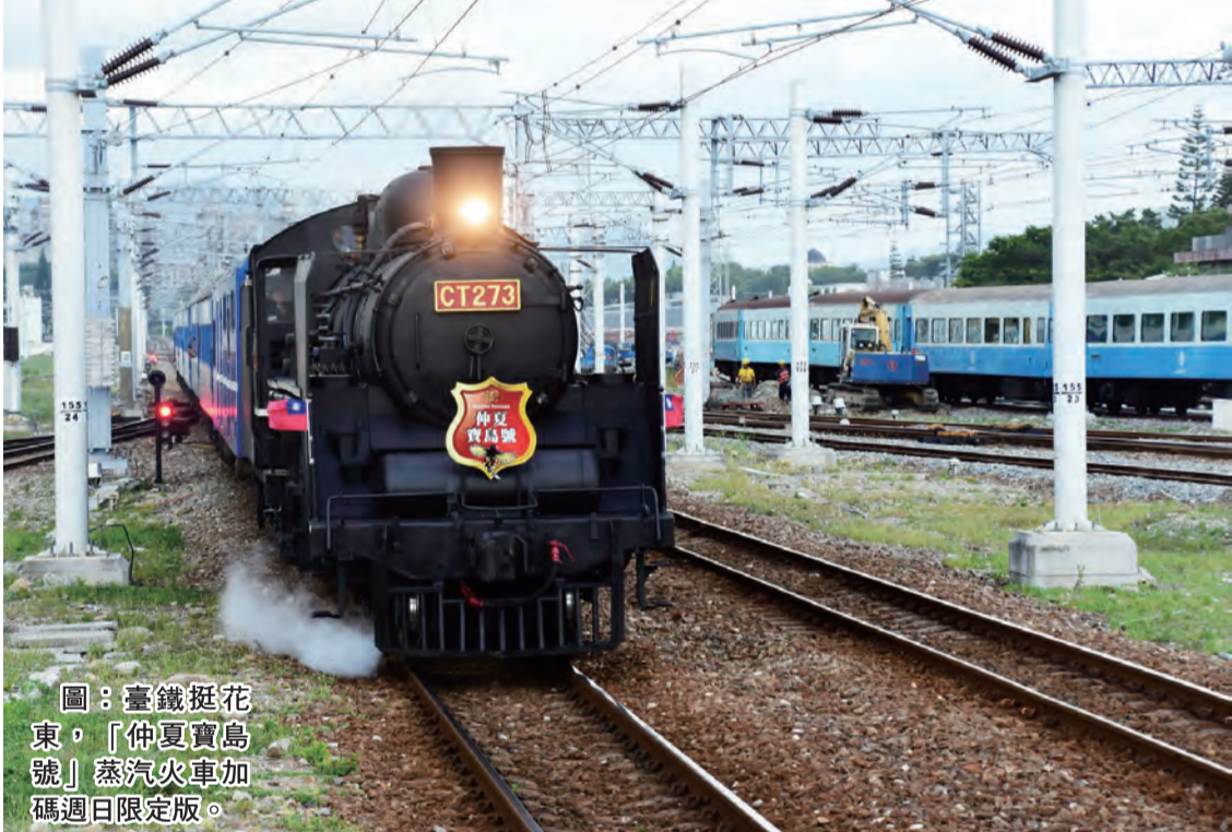
圖：台鐵挺花東觀光「仲夏寶島號」蒸汽火車加碼週日限定版。