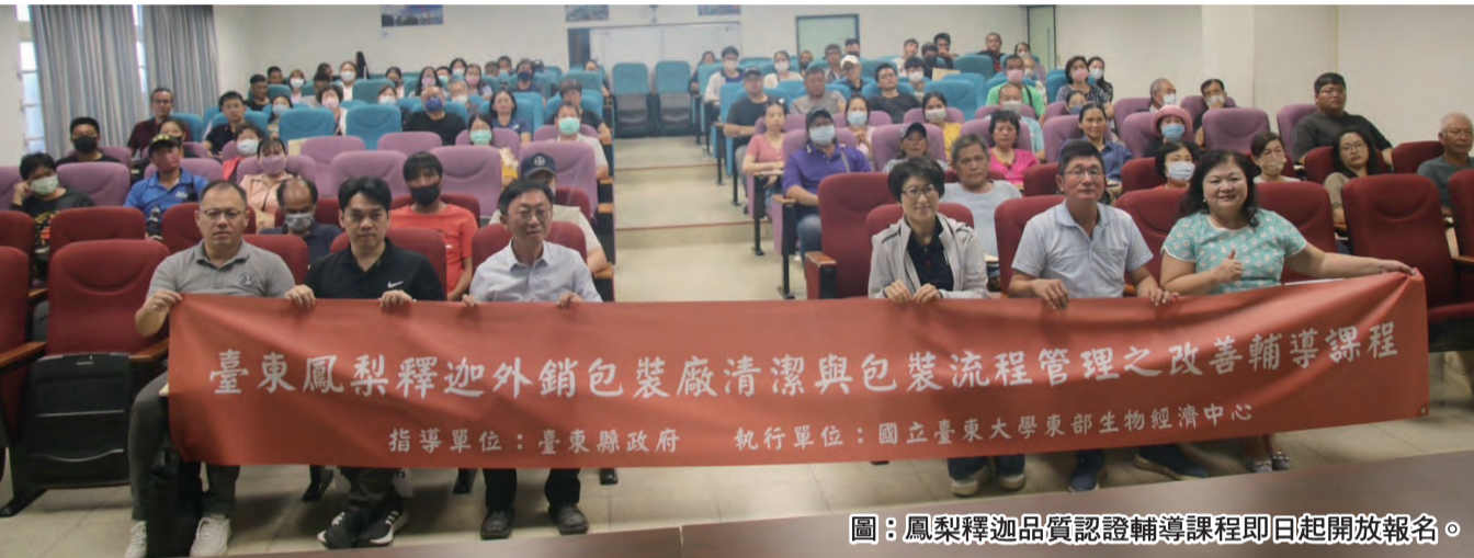
圖：鳳梨釋迦品質認證輔導課程即日起開放報名。

記者陳盈貞/報導 為輔導包裝廠符合台東鳳梨釋迦品質管理規範，台東縣政府與國立台東大學合作，自七月十六日起，辦理八場次「一三年度鳳梨釋迦品質認證輔導課程」，即日起開放報名，報名網址： http://www.taupapple.net/ 。