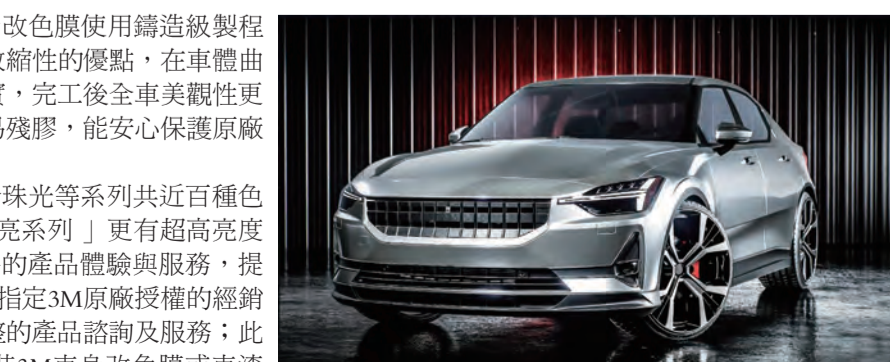
3M 車身改色膜，讓車主客製化改造愛車。

3M 車身改色膜開發亮面、緞面、霧面、特殊紋理、珍珠光等系列共近百種色彩花樣供車主選擇，全新推出的「3M 車身改色膜 2080 高亮系列」更有超高亮度鏡面效果的全新 12 花色供選擇。3M 台灣為提供更高規格產品體驗與服務，提醒車廠與車主選購 3M 車身改色膜及車漆保護膜產品時，指定 3M 原廠授權的經銷商：向榮貿易有限公司、忻承國際有限公司，提供最完整的產品諮詢及服務；此外，3M 特別祭出好康抽獎活動，即日起至 10/31 止，安裝 3M 車身改色膜或車漆保護膜，寄回保卡登錄，即可抽 iPad Pro 以及 3M 空氣清淨機！