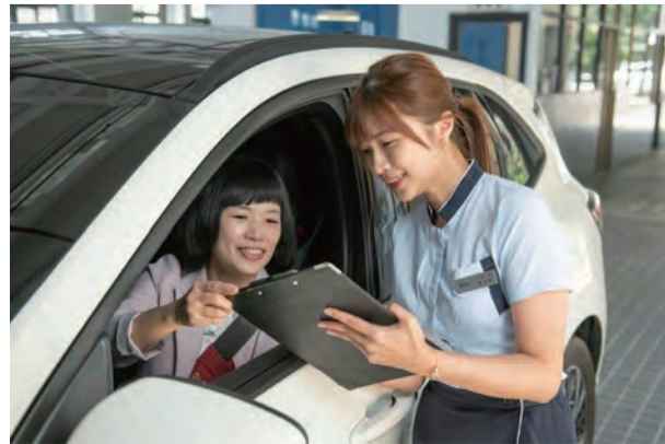
福特六和引進航空業標竿禮儀訓練，提供 Ford 車主回廠體驗款待服務。

不僅如此，Ford 全台各經銷據點包含展示中心、客休室、交車中心之軟硬體，皆已完成升級，採新世代「Ford Signature」品牌規範更新全套 Ford 展示中心暨服務廠各項軟硬體設備，並導入義大利百年傳奇經典 LAVAZZA 咖啡和 EVCO 氣泡水專等，打造更無微不至的顧客服務。