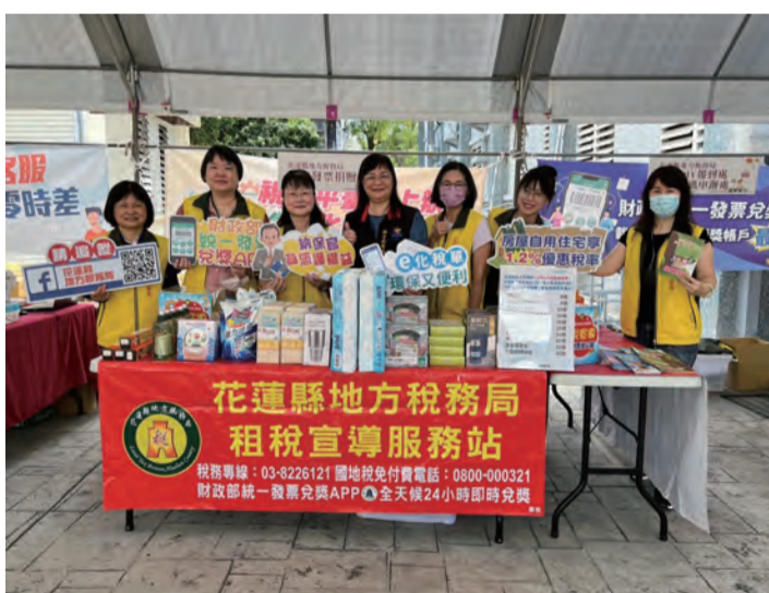
圖：花蓮縣地方稅務局租稅宣導服務站。

記者田德財/報導 「2024仲夏寶島號」一蒸汽火車自十二日開訂後迴響熱烈，秒殺售罄。為支持花蓮觀光發展，並回饋南台灣旅客，台鐵公司宣布加碼班次，增開由台東開往玉里第六六次仲夏寶島號，開行日期分別為七月十四日、七月二十八日及八月十一日，將於六月二十一日上午十時開訂。 台鐵公司表示，開行週日由台東開往玉里第六六次仲夏寶島號，上午九時二十六分自台東站出發，沿途停靠山里、池上、富里、玉里等站。 台鐵公司指出，為便利民眾參與活動，訂購上述車票，可於活動日前三日至開行前五日，憑「0403仲夏寶島號」四六六七次的車票至各站售票窗口加購前接駁車票。首次新自強號(台南)六點三十分開：新自強七點、高七點十分開、屏東七點二十八分、九點十九分到達台東站，九點十九分到達台東站，九點十九分到達台東站。 此外，傳說中到不了的秘境山里，鐵道作家劉克襄推薦的「山里」小教堂座落在山林中，是此生必訪的景點。在欣賞花東地區田野山風相輝映之際，又可親身體驗玉里車站更可以來場玉里麵及臭豆腐的美食饗宴。