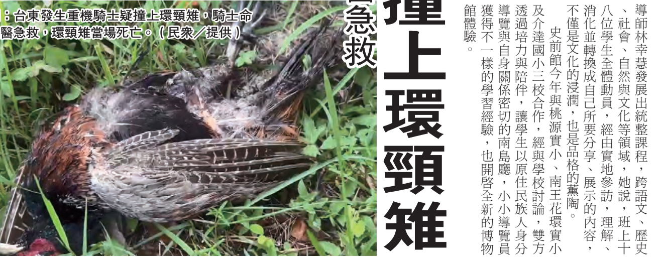
圖：台東發生重機騎士撞擊上環頸雉，騎士生命危急送醫急救，環頸雉當場死亡。(民衆/提供)

記者莊哲權/報導 騎重機疑撞上環頸雉 鹿野警重傷送醫急救。台東發生重機騎士撞擊上環頸雉，騎士生命危急送醫急救，環頸雉當場死亡。