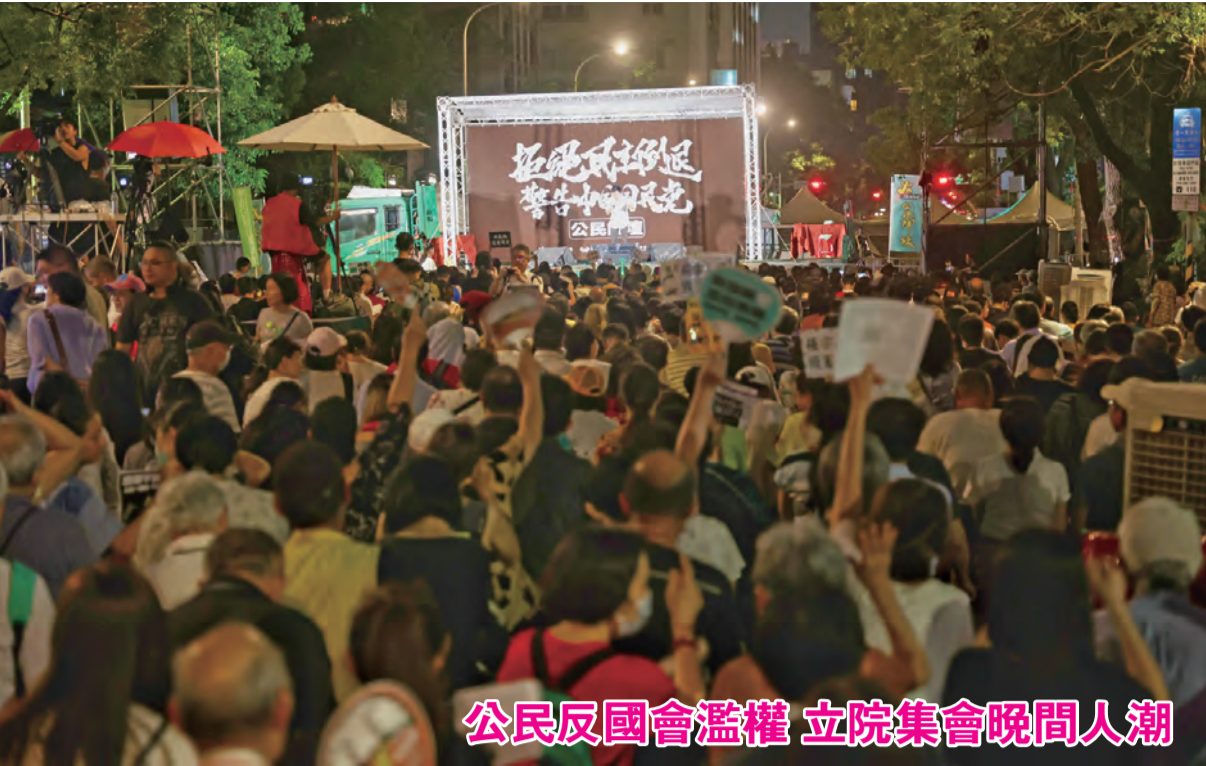
公民反國會濫權 立院集會晚間人潮