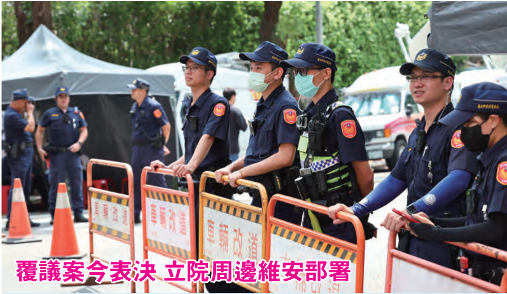
覆議案今表決 立院周邊維安部署

圖：行政院針對立法院職權修法案提出覆議，立法院21日院會將表決。上圖為20日立法院周邊加派警力戒備。 左圖：台灣公民陣線、經濟民主連合等公民團體發起「公民反國會濫權 重返立法院集結」行動，20日第2天晚間持續在立法院外舉辦公民論壇，入夜後現場人潮也變多。