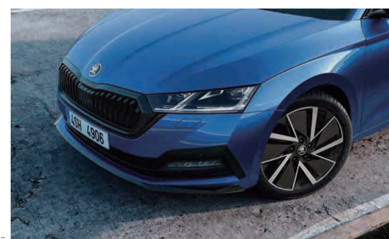
歐洲智世代旅行車 Škoda Octavia Combi 榮耀升級，限量推出冠軍運動套件。

乘客座八向電動調整座椅附記憶功能等配備，全面的提升舒適與機能性。更進一步升級 Sport Suspension 運動化懸吊以及 Progressive Steering 漸進式轉向系統兩款性能操駕配備，為消費者能帶來更美好的駕駛體驗。