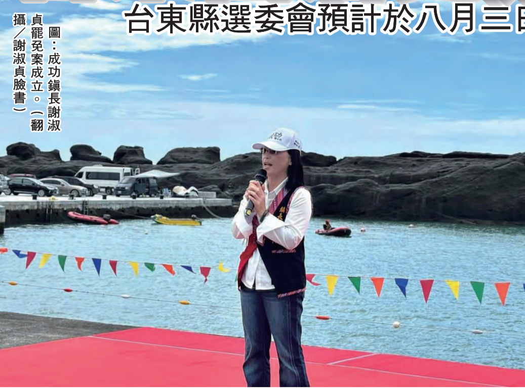
圖：成功鎮長謝淑貞罷免案成立。

記者陳盈貞/報導 台東縣成功鎮長謝淑貞罷免案，由陳姓民衆領銜提出的罷免案，經選委會於六月二十二日開票後，即被裁定撤銷，未訂到車票的旅客，僅能望穿秋水。支持罷免的選民，則在六月二十二日開票後，即被裁定撤銷，未訂到車票的旅客，僅能望穿秋水。支持罷免的選民，則在六月二十二日開票後，即被裁定撤銷，未訂到車票的旅客，僅能望穿秋水。