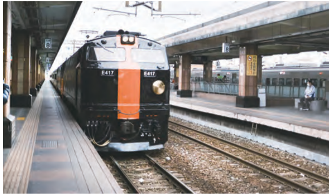
明日號黑色尊爵車體

點：天下萬物本來就沒有有形體，其來自於渾沌無垠之處，也必然終止於虛空冥然而止。在春暖花開的季節裡，人們的心緒總是愉悅無比，願意將塵世間的種種煩惱融入平凡而寧靜的心之中，用嘴角微微揚起的情緒面對一切，也許就會發現諸多平凡而自然的元素，都會轉化成優雅、寧靜與令人感恩的情境裡，您說是嗎？