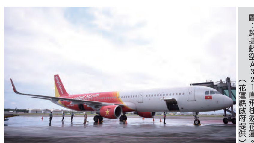
圖：越捷航空A321直飛往返花蓮。

【記者田德財/報導】花蓮縣政府與當地旅遊業者攜手合作，於今年七月五日至九月九日推出「花蓮-越南直飛包機」，促進花蓮旅遊產業及提升花蓮的國際知名度。預計吸引一八〇名越南遊客搭乘越捷航空A321直飛往返花蓮，展開為期五週的觀光之旅。花蓮至越南則滿載二〇三名親往峴港旅遊。