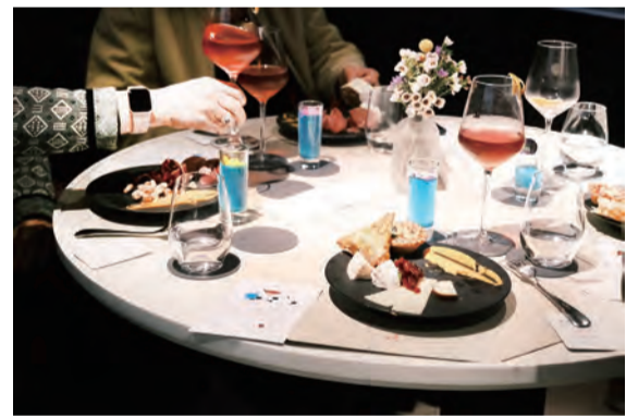
令人食指大動的餐飲