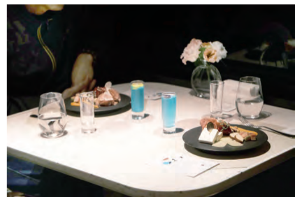
微醺品酒備感浪漫

點：天下萬物本來就沒有有形體，其來自於渾沌無垠之處，也必然終止於虛空冥然而止。在春暖花開的季節裡，人們的心緒總是愉悅無比，願意將塵世間的種種煩惱融入平凡而寧靜的心之中，用嘴角微微揚起的情緒面對一切，也許就會發現諸多平凡而自然的元素，都會轉化成優雅、寧靜與令人感恩的情境裡，您說是嗎？