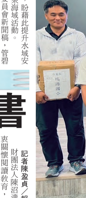
圖：陳沼濤文教基金會捐贈臺東縣國中小優良圖書。

陳沼濤文教基金會以每校每生四十元額度捐助各校購書經費，學校再依基金會提供的書單選取所需圖書，縣府於完成各校書單統計後，再由基金會進行採購，並依各校選取書籍分類整理裝箱，最後再親自送達臺東縣，讓各校領回。