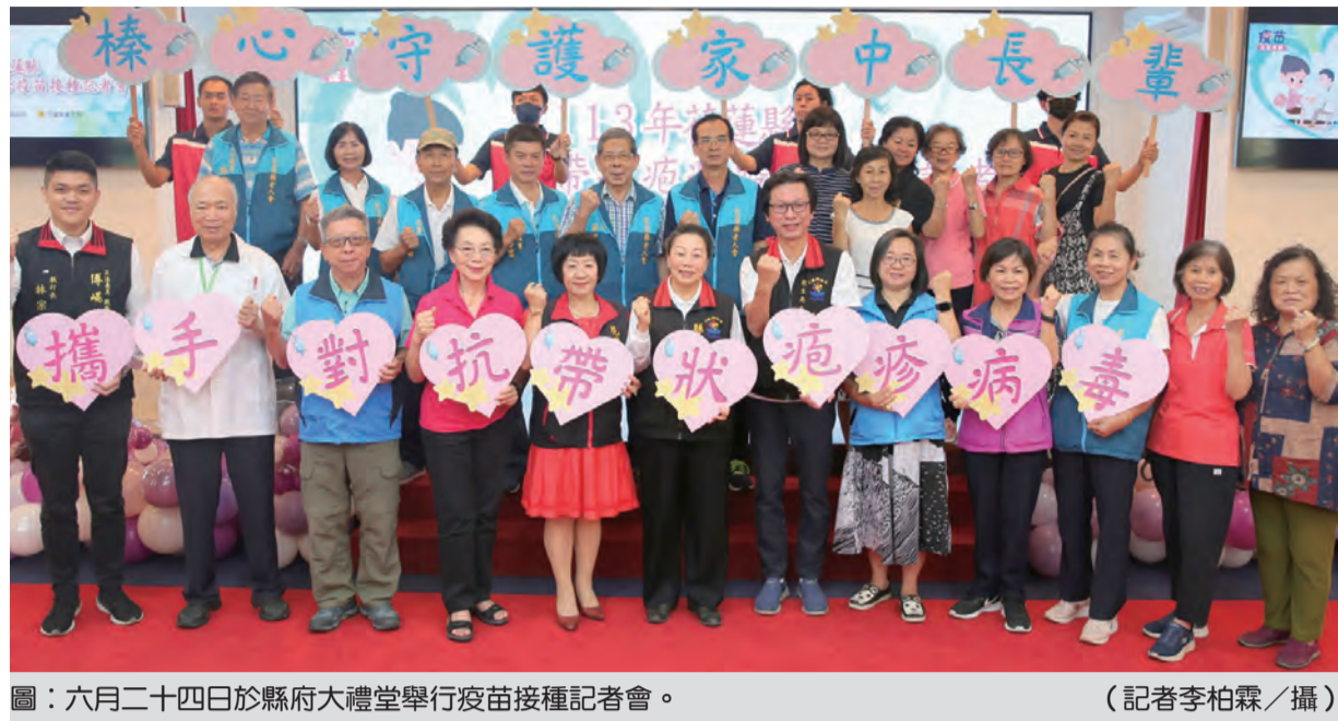
六月二十四日於縣府大禮堂舉行疫苗接種記者會。

接種對象為設籍花蓮縣50歲以上中低收入戶/低收入戶、65歲（原住民55歲）以上具有慢性病長者