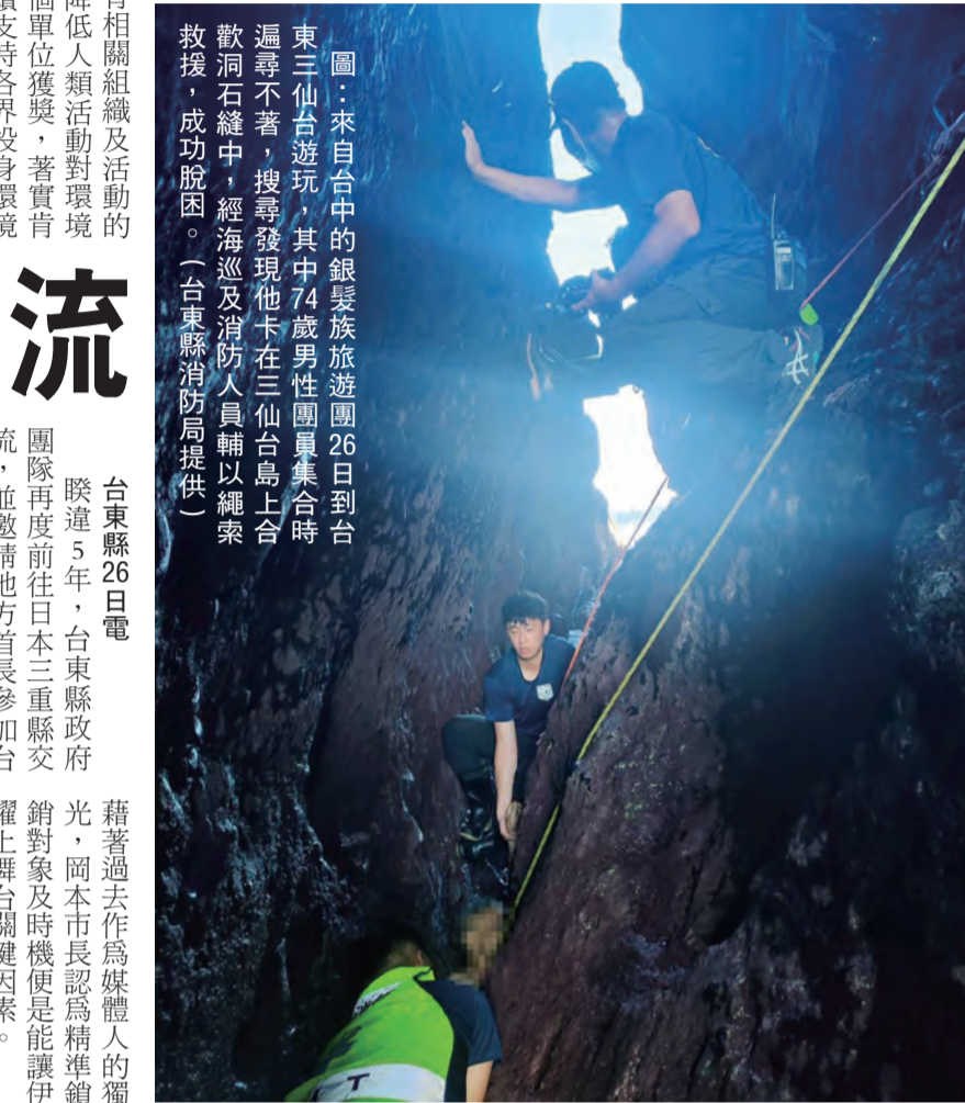
圖：來自台中的銀髮族旅遊團26日到台東三仙台遊玩，其中74歲男性團員合歡洞石縫，多處擦挫傷無大礙。

記者蕭道田/報導 7旬翁遊三仙台合歡洞石縫 警消防出擦挫傷無大礙 來自台中的銀髮族旅遊團，今天到台東成功鎮三仙台遊玩，其中74歲男性團員合歡洞石縫，多處擦挫傷無大礙。警消防出擦挫傷無大礙。警消防出擦挫傷無大礙。