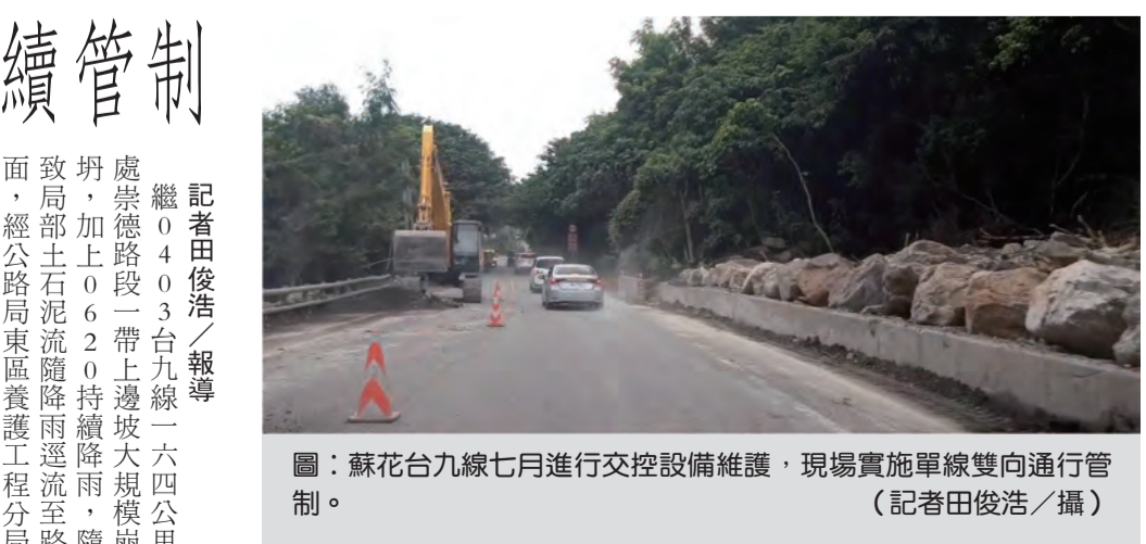
圖：蘇花台九線七月進行交控設備維護，現場實施單線雙向通行管制。

記者田俊浩/報導 繼0403台九線一六四公里處崇德路段一帶上邊坡大規模崩塌，加上0620持持降雨，隨致局部土石流流墜路雨造成路面，經公路局東區養護工程分局南澳工務段派駐現場之機具即時清理搶通後，東區養護工程分局排定七月一日至五日，每日九時至十七時於台九線160k+370、162k+780以及116k+830、117k+450、k+780以及116k+830、117k+450，辦理交控設備維護作業，現場實施單線雙向通行管制(非全線封閉)，請用路駕駛注意。 另，也排定七月八日至七月十一日，每日九時至十七時於蘇花台九線51k+820、63k+350，以及七月十二日，九時至十七時於台九線118k+750等處，辦理交控設備維護作業，現場實施單線雙向通行管制(非全線封閉)，請用路駕駛注意。 此外，排定自七月三日至四日上午八時至下午五時，辦理台二線162k+448、162k+491以及台九線12k+347、12k+390等處南北雙向進行路面修整施工，請用路駕駛配合現場管人員指揮通行。