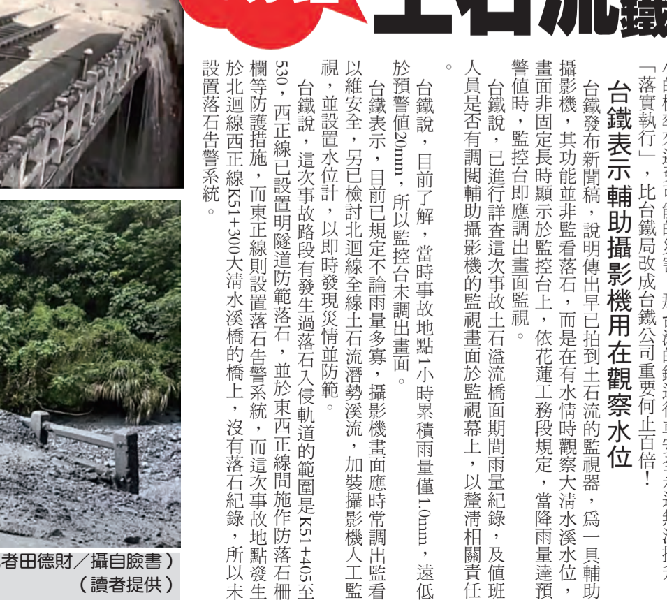
上圖：流出的監視器畫面土石流滾滾而下。(記者田德財/攝自臉書) 下圖：列車撞上的土石流現場。(讀者提供)

值班人員未及時通報 花蓮地檢署二十六日，有關媒體報導台鐵公司三九班次新自強號，於上月二十六日因土石流淹過軌道造成該列車出軌事件前，監測告警系統已拍到畫面，但負責監控之值班人員未及時通報而造成多位民眾受傷。事，因攸關民眾生命安全至鉅，本署獲悉後已於第一時間派員赴現場調查，後續將蒐集相關資料深入追查，儘速查明事實以釐清責任，並提出必要時追究相關人員之刑事責任，以維護民眾生命財產安全。