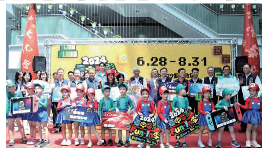
圖：台中電影fun-in季-6月28日起巡迴全市29區宣傳記者會，盧市長化身瑪利歐加碼抽機票。