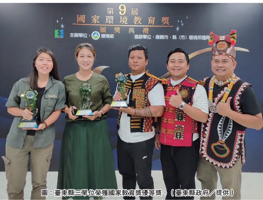
圖：臺東縣三單位榮獲國家教育優等獎。

野灣野生动物保育協會以野生保育及教育為目的，設立野生救傷醫院，投入生態調查，也推動環境教育，提升大眾對野生保育的認知及意識。各組的努力獲得評審好評，相信獲獎能給予地方團隊信心，持續為台東這片土地努力。 環保局進一步說明，台東縣雖然歷屆都有團隊或個人參賽，但要從全國決賽獲得首獎殊不容易。獲獎單位串聯不同領域的環境教育人才，結合在地特色建構多元文化與發展環境教育，將帶領其他環境教育仿效學習，實現環境教育產業化，散發關懷這片淨土的能量。