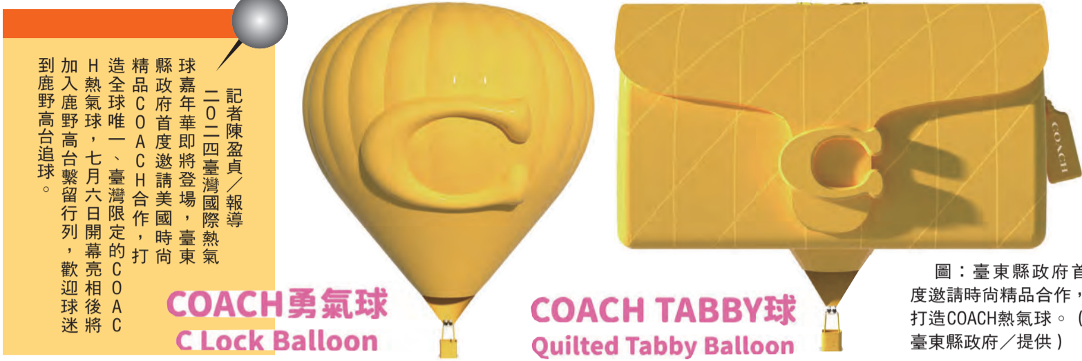
圖：臺東縣政府首度邀請時尚精品合作，打造COACH熱氣球。

兩款熱氣球設計概念 台東縣政府表示，此次COACH兩款熱氣球設計概念，源自於春季形象廣告「FIND YOUR COURAGE」，而其品牌標誌性的C字鎖扣、滿載活力的本季度表色，更是這次熱氣球設計的靈感來源。 擁抱未知與打破框架 此次縣府邀請知名精品業者的合作，巧妙融合COACH熱氣球同樣代表擁抱未知、打破框架、實現夢想的勇氣。 球迷今夏最難忘回憶 雙方合作的驚喜不僅於此，COACH熱氣球更以本季新穎工藝打造的經典TABBY新色，化作超過二十公尺高的鉅畫手工袋造型球，其菱格線與Logo皮牌