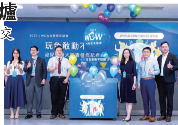
↑「玩色敢動不設限」行動宣言禮物盒為國人泌尿健康送上祝福

廖俊厚理事長表示：雖然老化也會帶來尿失禁的影響，但也有生理機能的異常因素，如糖尿病、泌尿道感染、失智、中風、心血管疾病、攝護腺問題所發出的警訊，應盡早尋求醫療協助。遇到尿失禁時應對解決方式時，有高達82%民眾願意選用內褲型成人紙尿褲，相較台灣尿失禁防治協會2019年調查時僅有63%會選擇專用產品，顯示國人對健康議題的認識以及失禁專用產