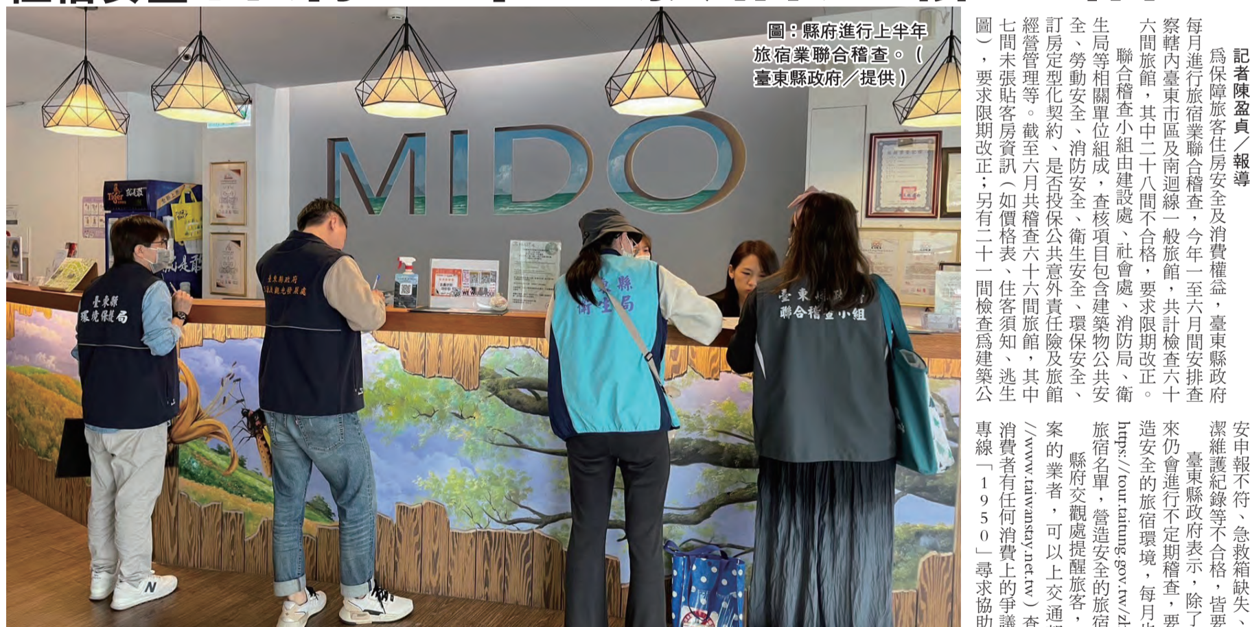
圖：縣府進行上半年旅宿業聯合稽查。

旅宿業聯合稽查 記者陳盈貞/報導 為保障旅客住宿安全及消費權益，臺東縣政府每月進行旅宿業聯合稽查，今年一至六月間共計六十六間旅館，其中二十八間不合格，要求限期改正。 聯合稽查小組由建設處、社會處、消防局、衛生局等相關單位組成，查核項目包含建築物公共安全、勞動安全、消防安全、衛生安全、環保安全、訂房契約、是否投保公共意外責任險及旅館經營管理。截至六月共稽查六十六間旅館，其中七間未張貼客房資訊(如價格表、住客須知、逃生圖)，要求限期改正；另有二十一間檢查為建築公