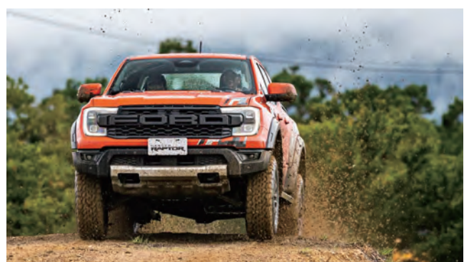
↑New Ford Ranger，憑藉強悍的全地形越野征服實力、全新升級的科技數位座艙以及先進安全科技，成為全球皮卡(Pick-up)市場的領導者。