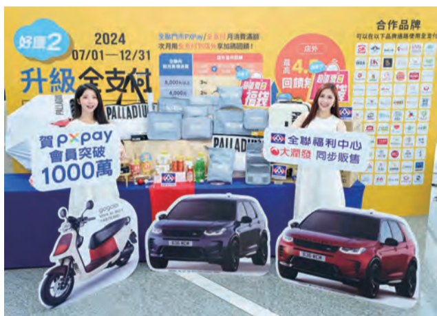
→全聯夏日限量福袋抽百萬名車！

月店外最高可享全點4.5%回饋，讓消費者走出店外消費也優先使用全支付，不只在全聯省錢，更要一路省出全聯！(記者/蔡宛玲)