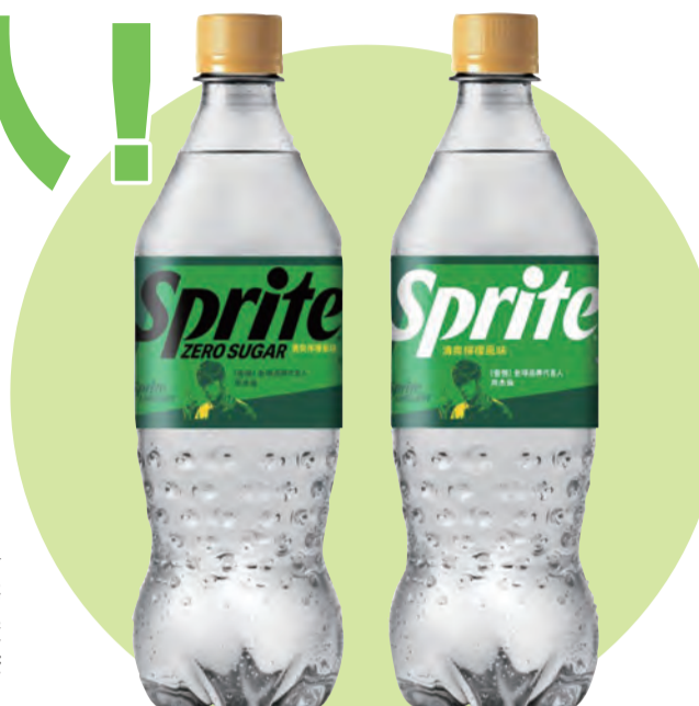
↑「雪碧」全球品牌代言人周杰倫限定包裝_雪碧無糖(圖左)雪碧(圖右)_600ml

碧」周杰倫限量版包裝，用手機掃描瓶蓋內QR Code或輸入易開罐罐底序號，成為COKE+會員並集滿三點即可參加抽獎活動，有機會抽中多項雪碧專屬夏日潮酷好禮，獎項不僅有GoPro HERO 12等大獎，更包括典藏經典的「唱爽你的夏天組合」，內含一體式黑膠唱機、周杰倫經典專輯的珍藏雙黑膠唱片與周杰倫獨家親筆簽名海報，用音樂演繹雪碧「透心涼心飛揚」的經典滋味！(記者/李秉添、蔡宛玲)