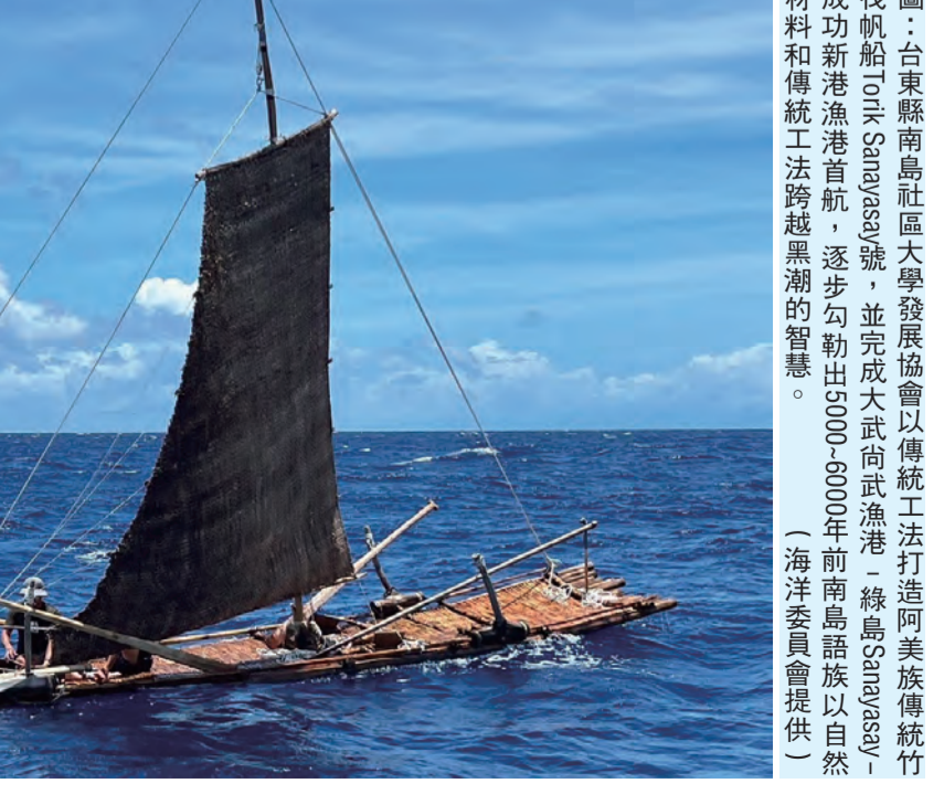
圖：台東縣南島社區大學發展協會以傳統工法打造阿美族傳統竹筏帆船Tack Sanjaya號，並完成大武向武漁港-綠島Sanjaya-成功新港漁港首航，並完成大武向武漁港-綠島Sanjaya-成功新港漁港首航，並完成大武向武漁港-綠島Sanjaya-成功新港漁港首航。

台東旅遊未回溫 台東縣政府表示，即使中央及縣府都祭出旅遊住宿優惠，台東觀光業仍未回溫，國民黨立委黃建賓呼籲台東一體、觀光署提前實施台東旅遊補助，並不分平日假日補助1000元。 黃建賓指出，台東縣政府推出「6月住台東、抽萬元旅遊金」活動，但6月端午連假住宿率只有三成，近期準備迎接最重要的暑假觀光旺季，但目前旅遊住宿率仍未回溫，地產後影響持續，讓台東觀光業者苦不堪言。 黃建賓指出，行政院長卓榮泰日前宣布將旅遊補助提前從6月24日起施行，並不分平日、假日皆補助新台幣1000元，但台東卻沒有涵蓋在內，完全沒感受到政府在乎台東觀光。 黃建賓表示，台東兩縣是一體的，中央應把台東納入提前施行、並擴大補助範圍，讓台東觀光產業走出0.403地產陰霾。