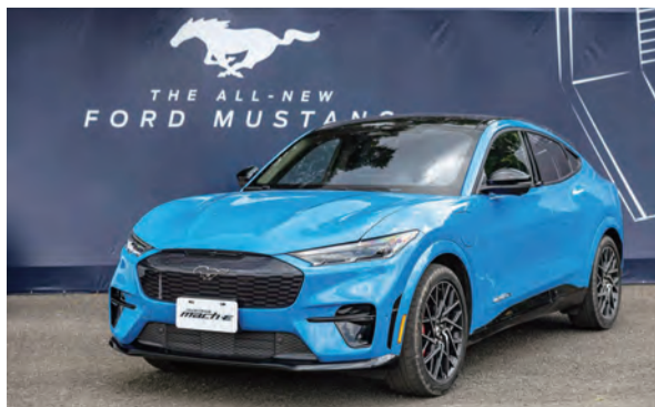
The All-Electric Mustang Mach-E，集結品牌各項電池能源動力科技，並完美結合Ford源自賽道的運動化競技DNA及崇尚自由的駕駛風格；帶來超乎同級的駕駛樂趣。

New Ford Ranger Raptor以「高速越野」與「極致性能」為開發訴求，搭載3.0L EcoBoost V6 雙渦輪增壓汽油引擎，展現同級罕至的292ps、50kg-m狂傲動力，結合SelectShift™十速手排變速箱(E-Shift電子式排檔系統)配置，0至100km/h加速僅需7.9秒的同級最佳表現。