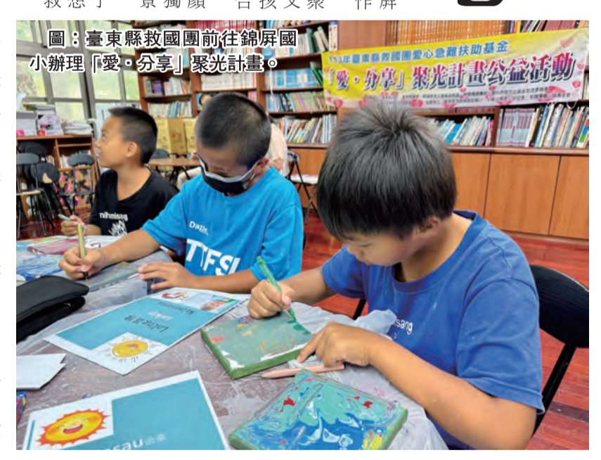
圖：臺東縣救國團前往錦屏國小辦理「愛·分享」聚光計畫。

安申報不符、急修箱缺失、體檢未出示、無飲用水 潔維護紀錄等不合格，皆要求限期改正。 臺東縣政府表示，除了每月的定期聯合稽查，未來仍會進行不定期稽查，要求業者落實自主管理，營造安全的旅宿環境，每月也會在臺東觀光旅遊網(www.taiwan.gov.tw)查詢合法旅宿資訊，並呼籲消費者有任何消費上的爭議，可撥打全國消費者服務專線「1950」尋求協助。