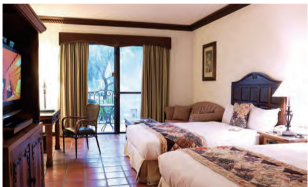
理想大地推出「輕慢野」住房優惠專案，可享政府補助不平假日一律一千元。