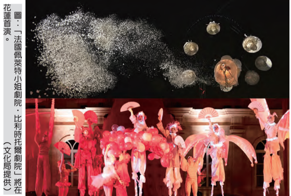
圖：「法國佩萊特小姐劇院·比利時托爾劇院」將在花蓮首演。

記者謝宗璋/報導 花蓮縣文化局今年再度開啓東西國際競演的藝術劇院，六月廿九、卅日連兩晚七時在日出大道重慶市場旁，邀請「法國佩萊特小姐劇院·比利時托爾劇院」首演。免費索票僅剩文化局臨時圖書館，現場將開放有票者優先入場，無票者可現場排隊候補。 法國佩萊特小姐劇院(Mademoiselle Paillette)自二〇〇六年開始國際巡迴演出，超過廿個國家演出，曾受邀逾廿五個國家演出，為尼爾斯嘉年華、巴黎迪士尼樂園、各國國際藝術節邀請常客，這次為花蓮帶來經典童話故事劇作《美女與野獸》。 比利時托爾劇院(Theater Tolo)成立於一九九八年，幾乎不用任何語言，運用影像視覺、肢體動作、演出和音樂，呈現宛如戲劇般的完美節目。這次帶來《天使花園》，以多采炫麗的音樂、舞蹈、燈光特效、幻彩變化，在空中中演繹。