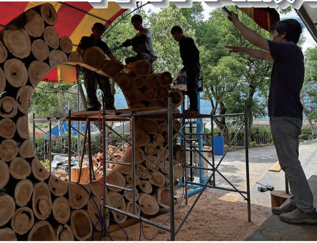
圖：「縱谷大地藝術季-漂鳥197」7月1日開展，今年邀請到5組國外藝術家、7組台灣藝術家參與創作，作品分別設置在富里鄉、池上鄉、關山鎮及鹿野鄉等地的秘境。圖為藝術家駐地創作地景藝術作品。