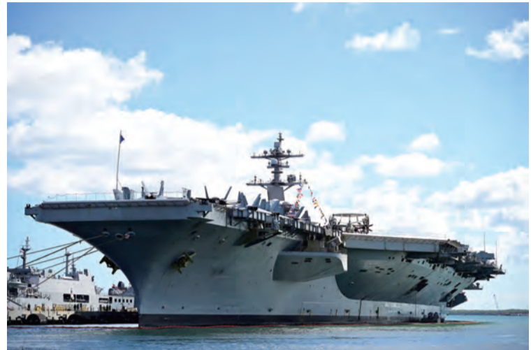
圖：美國卡爾文森號航空母艦(USS Carl Vinson, CVN-70)停靠夏威夷珍珠港海軍基地，參與2024年環太平洋軍事演習。

華盛頓27日綜合外電報導，2024年美國總統大選首場辯論(見圖、路透)，美國主流媒體認為這90分鐘期間現任總統拜登的表現一如民主黨所擔心，缺乏活力和鬥志，川普則一反常態保持相對冷靜克制。