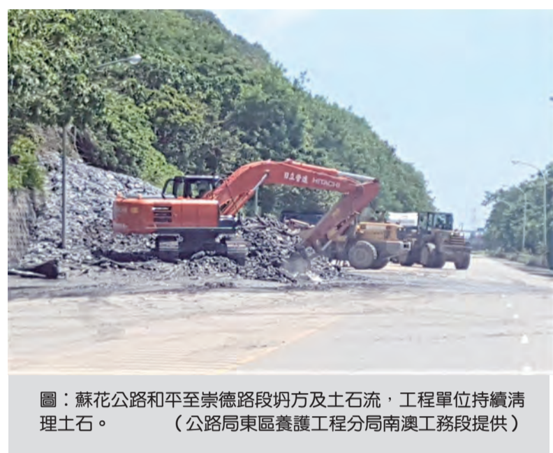
圖：蘇花公路和平至崇德路段坍方及土石流，工程單位持續清理土石。

記者賴文康/報導 發生坍方的台八線中橫公路布洛灣路段，公路局東區養護工程分局太魯閣工務段接獲通報，立即動員人員和機械趕往現場搶修。原預計下午五點搶通的路段，因上邊坡開挖落石情形減緩，巨石破碎作業方式進行的相繼順利，工務段搶災團隊提前在下午兩點搶通單線，並供相關公共工程搶災車輛(如台電電力搶修車)先行通行後，即行封閉管制。 公路局東區養護工程分局太魯閣工務段指出，三十日上午九點左右，台八線中橫公路布洛灣路段(一百七十八公里)道路左邊坡坍方，數塊巨石滾落路面阻斷交通(重量逾百噸以上)，在接獲通報後，立即動員工程人員、機械趕往現場展開搶修。 公路局東區養護工程分局太魯閣工務段表示，原預計在下午五點左右可以搶通的路段，因上邊坡開挖落石情形減緩，加上採取巨石破碎作業方式進行的相繼順利，工務段搶災團隊提前在下午兩點搶通單線，並供相關公共工程搶災車輛(如台電電力搶修車)先行通行後，即行封閉管制。 至於後續搶災工作的清理作業，下次開放民眾通行時段，為原訂管制措施的下午四點半至五點半放行時段；另外在下午五點半至六點半只出不進，下午六點半以後，夜間則實施道路封閉管制。 公路局呼籲用路人，地震過後及暴雨(或連續降雨)期間，山區道路易坍方、落石，路況難以掌握，非必要請勿於災後進入山區，並應隨時注意氣象資訊及道路封閉資訊，事先規劃行程應變準備。請充分利用公路局智慧化省道即時資訊服務網( http://168.tb.gov.tw )或手機下載「幸福公路APP」及收聽路況廣播資訊，掌握最新道路資訊，承辦單位太魯閣工務段，路況查詢電話(〇三)九九六二六八三。