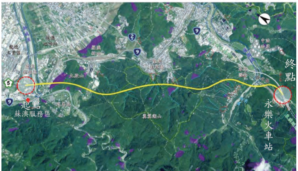
圖：國五銜接蘇花改示意圖。