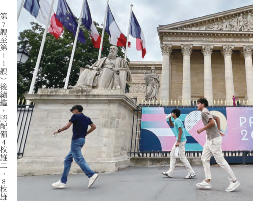
圖：2024年6月29日，法國巴黎，人們走過張貼巴黎奧運廣告海報的國會。距離法國巴黎奧運開幕只剩不到1個月的時間，屆時預計會有大量遊客湧入巴黎。

沱江級艦以台灣的河(溪)或除役艦艇的艦名命名，有別於原形艦，沱江級量產艦除原有雄風二型反艦飛彈、7.6快砲及方陣快砲，並配備由中科院研製的海劍二防空飛彈，使其同時具備對空、對海攻擊能力。根據公開資料，相較於原形艦後續艦的第一批次(第2艘至第6艘)配置8枚雄二、4枚雄三，第二批(第7艘至第11艘)後續艦，將配備4枚雄二、8枚雄三，以滿足作戰實際需求。