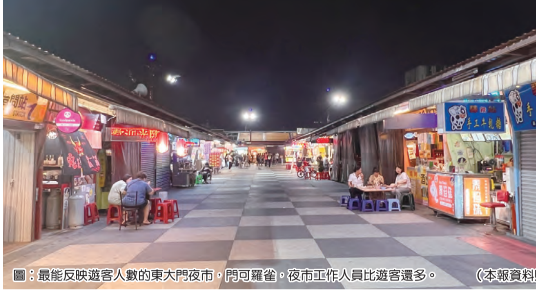
最能反映遊客人數的東大門夜市，門可羅雀。夜市工作人員比遊客還多。

並非遊客正確人次，因封園，震後前往太魯閣國家公園的遊客應該掛零。 平時遊客前三名之一的台泥在蘇花公路和PDA K A園區，一到三月份平均每月有十二萬餘人次，四月份僅剩一萬七千人次，五月回升到二萬三千餘人次，等於說，四月份比平時少了七十餘萬人次。東大門夜市平均每月有二十萬人次，四月份僅有五萬五千人次，平均一天僅約一千八百多人次。 其次豐濱海岸山脈的親不知天古道，平時每月有二萬五千餘人次，四月份僅有九千九百餘人次，相當於一天的人次。石碇物館以外地遊客訪訪為主，平時每月有二千五百多人次參觀，結果四月份僅六百多人次。 五月休園掛〇；海洋公園二月份有六萬七千多人次，三月有三萬八千多人次，四月休園僅有一千六百多人次，比二月少了一〇四倍。五月休園也掛〇。 花蓮國旅補助六月一日上路，不分假日每房最高補助新台幣一千元。花蓮旅宿業者說，但並未太多的吸引力，端午連假住宿一成多，還在觀望振興效益，若持續有餘慶，恐再下降。