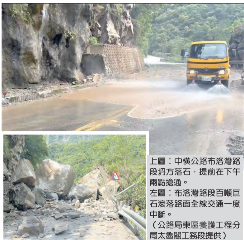
上圖：中橫公路布洛灣路段坍方落石，提前在下午兩點搶通。左圖：布洛灣路段百噸巨石滾落路面全線交通一度中斷。

記者賴文康/報導 發生坍方的台八線中橫公路布洛灣路段，公路局東區養護工程分局太魯閣工務段接獲通報，立即動員人員和機械趕往現場搶修。原預計下午五點搶通的路段，因上邊坡開挖落石情形減緩，巨石破碎作業方式進行的相繼順利，工務段搶災團隊提前在下午兩點搶通單線，並供相關公共工程搶災車輛(如台電電力搶修車)先行通行後，即行封閉管制。 公路局東區養護工程分局太魯閣工務段指出，三十日上午九點左右，台八線中橫公路布洛灣路段(一百七十八公里)道路左邊坡坍方，數塊巨石滾落路面阻斷交通(重量逾百噸以上)，在接獲通報後，立即動員工程人員、機械趕往現場展開搶修。 公路局東區養護工程分局太魯閣工務段表示，原預計在下午五點左右可以搶通的路段，因上邊坡開挖落石情形減緩，加上採取巨石破碎作業方式進行的相繼順利，工務段搶災團隊提前在下午兩點搶通單線，並供相關公共工程搶災車輛(如台電電力搶修車)先行通行後，即行封閉管制。 至於後續搶災工作的清理作業，下次開放民眾通行時段，為原訂管制措施的下午四點半至五點半放行時段；另外在下午五點半至六點半只出不進，下午六點半以後，夜間則實施道路封閉管制。 公路局呼籲用路人，地震過後及暴雨(或連續降雨)期間，山區道路易坍方、落石，路況難以掌握，非必要請勿於災後進入山區，並應隨時注意氣象資訊及道路封閉資訊，事先規劃行程應變準備。請充分利用公路局智慧化省道即時資訊服務網( http://168.tb.gov.tw )或手機下載「幸福公路APP」及收聽路況廣播資訊，掌握最新道路資訊，承辦單位太魯閣工務段，路況查詢電話(〇三)九九六二六八三。