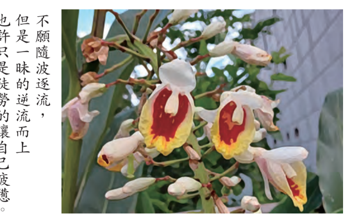
不願隨波逐流，但也是一味的逆流而上... 《1984》