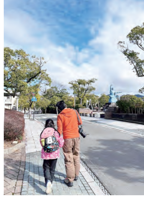
父女牽手共學歷史課