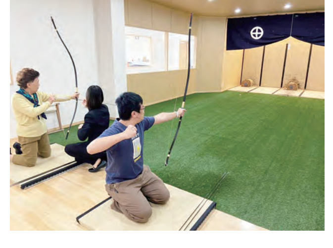
學拉弓射箭的武士道