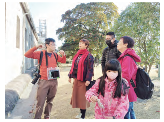
牛奶妹解說仙巖園典故

日前老闆要我幫忙把微信裡的視頻轉到Ave，初始以為另存新檔到電腦桌面再轉傳出去即可。哪知某些視頻無法下載，正在傷透腦筋之際，突然想起友人，他是這方面的專家，或許能助一臂之力。果不其然，他三兩下功夫，視頻就轉到我的巨。除了致謝，也詢問如何操作。友人很熱心將操作網址給我，可惜我的手機品牌不同，無法照章辦理。之後，再遇到此需求時，便厚著臉皮尋求友人協助。其實，我頗感歉意，於是告訴自己，一定要去詢問手機行。 拖了好幾天，駝鳥心態作怪，料想應該還沒那麼快又有任務。念頭才剛過，老闆又丟來幾個視頻。正在惱惱不安，剛好同事從旁經過，於是我試著詢問他這個問題。慶幸同事對任何問題都很樂意幫忙，不一會兒功夫就完成。聊天中得知新同事的姊姊開手機行，於是託他詢問我的手機型號如何操作登錄錄影。 新同事覺得這等小事自己摸索即可，他試著下載Ave，但後來發現，根本不用下載，而是手機裡原本就有這個功能。天啊，我像發現新大陸般的雀躍不已。不經一事，長一智，手機裡還有好多內建的功能，因為沒遇到問題，便不會去使用，真是感謝這個新任務，又教會我一個新功能。 其實生活中常會遇到各式各樣的問題，或許可以請人幫忙，但如果能自己學會解決方法，這就不但不再去麻煩別人，還能增進自己的能力。這就好比以前遇到不如意時，總是拉著姊妹淘吐苦水。雖然她們很願意聽我的抱怨，但時日久矣，連自己已感到厭倦。不過自從接觸佛法，深入經藏，聆聽法義，我對掌控情緒有了新的認識。很多時候，不是事件本身，而是人的情緒的問題。爾後，我慢慢練習任何處境要轉念，不再靠找人訴苦解脫。這樣的練習，鍛鍊自己的心性，更加堅定自己的意志。 只要是正向的信仰都能幫助我們提升自己，而擺脫依賴的性格，是我目前最大的收穫。用開放的心，相信能讓自己更精進。*