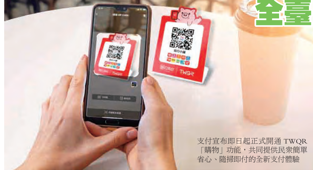
支付宣布即日起正式開通 TWQR「購物」功能，共同提供民衆簡省、隨掃即付的全新支付體驗

為推動整體電交支付持續成長，街口支付（JKOPay）響應金管會完善零售支付共用基礎設施政策，宣布7月1日起正式開通電交跨機構共用平台 TWQR「購物」功能，民衆即日起即可於全臺 TWQR 店家使用街口支付 App 進行掃碼付款，期能與財金公司及各家支付業者共同實現更為輕便便利的跨平台支付服務。民衆可先將街口支付 App 升級至最新版本，只要看到全臺有張貼「TWQR 立牌」的實體商