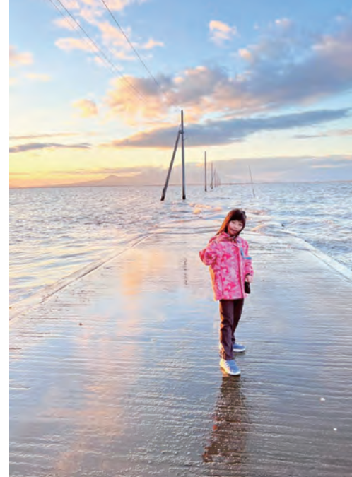
牛奶妹走在海床路，體驗摩西渡紅海。