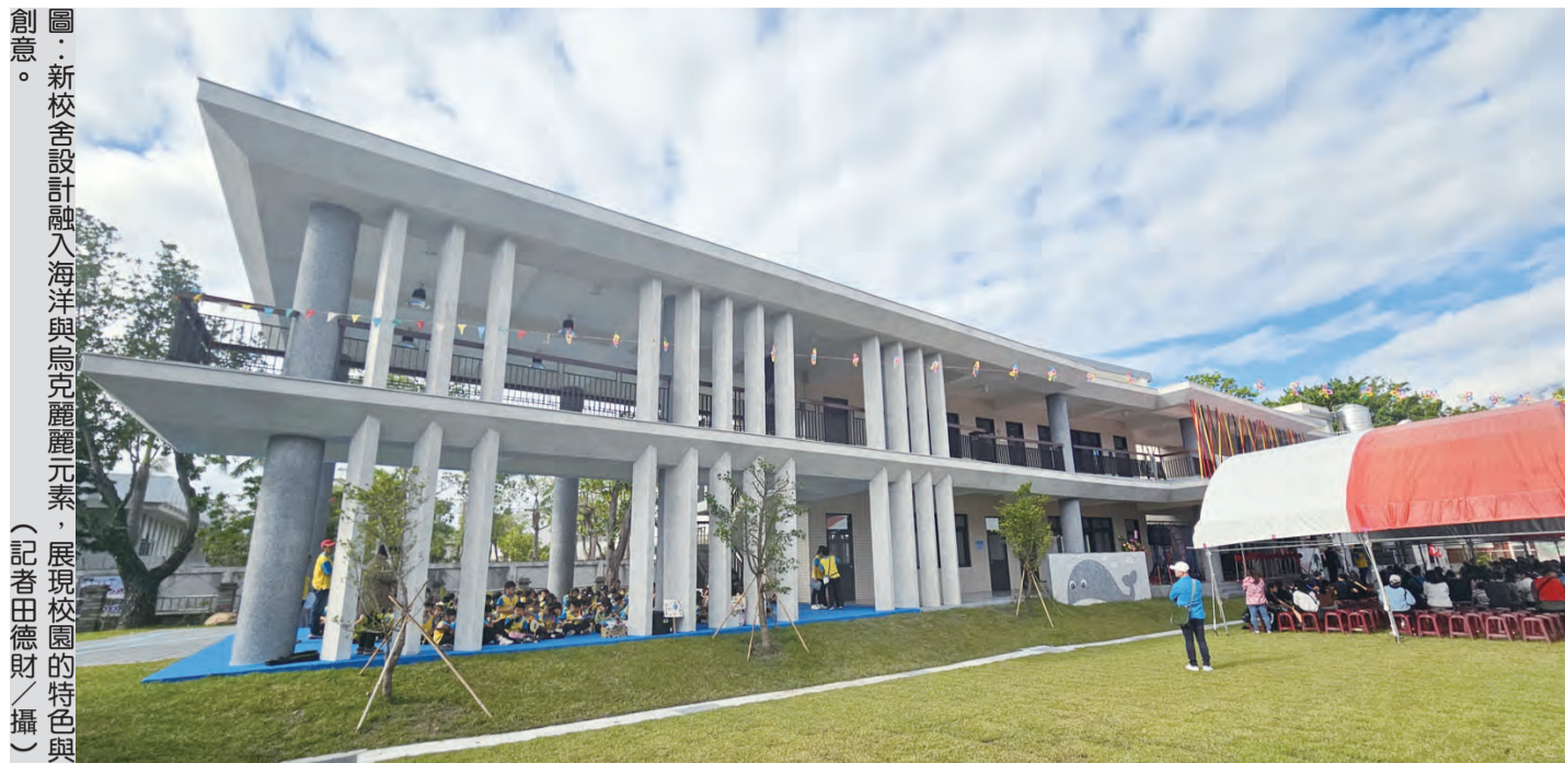
圖：新校舍設計融入海洋與鳥兒元素，展現校園的特色與創意。