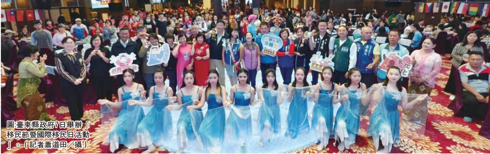
圖：台東縣政府7日舉辦「移民節暨國際移民日活動」。

為了讓新住民朋友在臺東感受到更多的關懷與支持，臺東縣政府今(7)日舉辦「移民節暨國際移民日活動」，邀請來自各國的新住民朋友共同參與，慶祝屬於新住民的節日。議長吳秀華、縣府民政處長林宏義、立委莊瑞雄、東部聯合服務中心執行長洪宗楷、移民署臺東縣專勤隊副隊長及同仁等多位貴賓到場致意。縣長饒慶鈴表示，縣府將繼續透過多元活動及跨界合作，促進新住民融入社會，並感謝新住民朋友為臺東帶來的文化多樣性，期盼大家共同努力，讓這塊土地更溫馨、和諧。