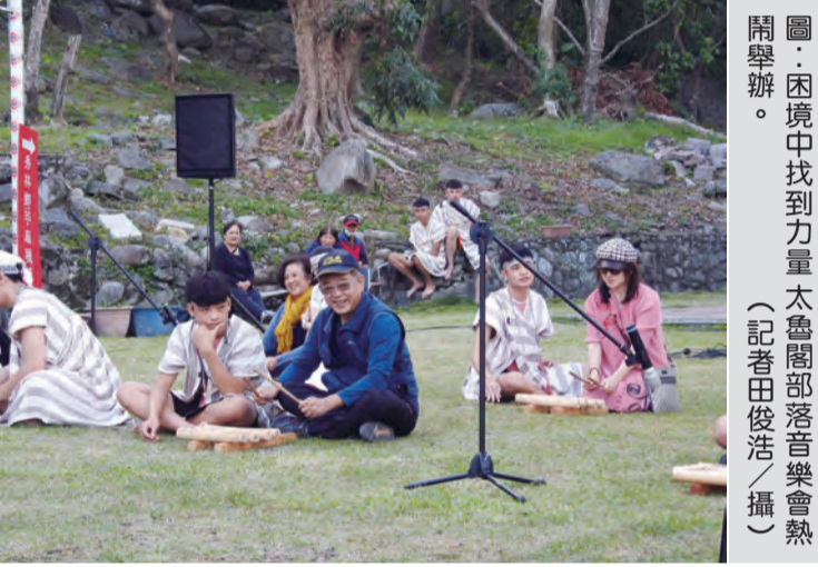
圖：困境中找到力量 太魯閣部落音樂會熱鬧舉辦。

記者田俊浩／報導 鑒於災後重建和旅遊發展，需多方參與與協作下，太魯閣部落音樂會七日在富世村太魯閣文創園區舉辦音樂會，由在地樂團、一好、劣劣、峽谷樂舞團、葛蘭音樂工作室、四維高中、比亞瑟樂團及瑪大恆舞集等演出，吸引民眾好評，在困境中找到力量。 此外，太魯閣處長劉守禮在地鄉親期望實現災區經濟復甦和可持續發展，為遊客提供安全、優質的旅遊體驗下，因此二場次太魯閣部落音樂會演出，太魯閣處長劉守禮也根據當地資源和需求進行調整和組合，也於演出當天，從上午十時至下午活動，安排原住民風情市集、品味手作與文化等活動，以期以創造就業，且吸引遊客的旅遊體驗，以提升地方觀光吸引力。 對於災後重建，自然與人的力量，這一場次太魯閣部落音樂會依序在地舞團舞團演出，猶如與環境共舞的柔韌之美，象徵著困境中重生勇氣，在前進道路上面對挑戰，展現將逆境化為成長的動力以及對未來的信念。