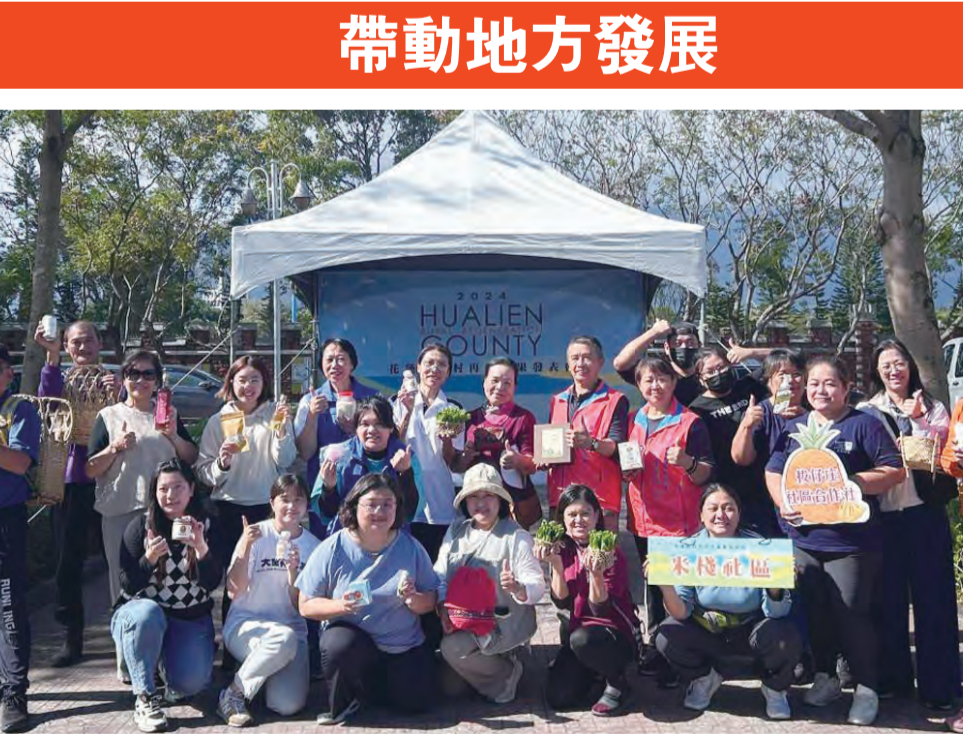
圖：農村再生成果發表會現場，多位人士參與。(圖/花蓮縣政府提供)

記者劉怡伶／報導 農村再生政策20年，地方政府在推動農村發展上扮演著更關鍵的角色。花蓮縣政府積極整合各社區資源，結合在地特色，成功打造出獨具魅力的農村風貌，不僅促進城鄉發展，更成功保存了珍貴的農村文化。(圖/花蓮縣政府提供) 為展現近年來農村再生豐碩成果，花蓮縣政府特舉辦「花蓮農村再生成果發表會」，七日上午十時，在知卡宜綠森林親水公園廣場。活動邀集花蓮縣13個社區共同參與，透過市集擺攤、展覽等多元方式，將年度農村再生計畫的軟硬體成果一覽無遺地呈現給民眾。 參與展出社區，有新佳民、七星潭、南華、光華、米棧、中興、富源、松浦、竹田、羅田、石平、加里山、香茅場等，每個社區都將帶來獨具特色的農特產品、手工藝品及DIY體驗活動。光華社區空氣鳳梨盆栽手作，民眾透過手作空氣鳳梨盆栽，體驗綠意，過程中也可以訓練手眼協調，促進身心靈健康；另新佳民社區，則將社區特色作物山蘇，製作成多種特色產品，讓參加者更加了解山蘇的特色。現場手作DIY，以不一樣巧思，展現社區亮點，受到民眾歡迎。 花蓮縣政府農產處表示，透過成果發表會，期望能提升花蓮農產及農村的知名度，讓更多人認識花蓮農村的美好；同時藉藉此機會凝聚更多人的共識，推廣花蓮農村的美好價值與精神，讓民眾認識花蓮農村的真善美，共同為花蓮的永續發展貢獻心力。