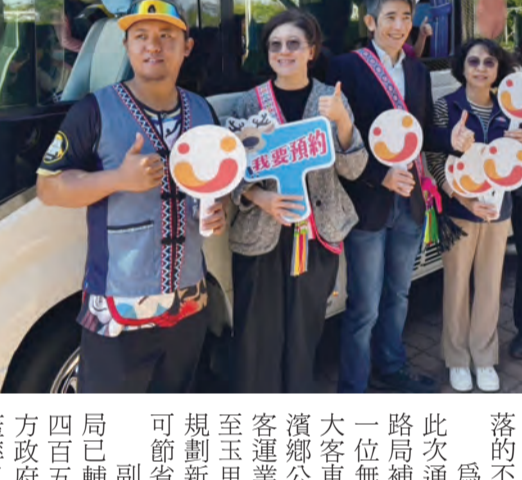
圖：長濱幸福巴士首條跨域生活線啟航。

長濱幸福巴士首條跨域生活線啟航 記者蕭道田/報導 為完善臺東縣長濱鄉內及聯外公共運輸，公路局高雄區監理所攜手臺東縣政府，協同鄉公所規劃新增兩條幸福巴士路線「玉長跨域生活線」、「全鄉全預約線」，並添購一輛無障礙中型巴士，讓幸福巴士服務更貼近鄉民生活。