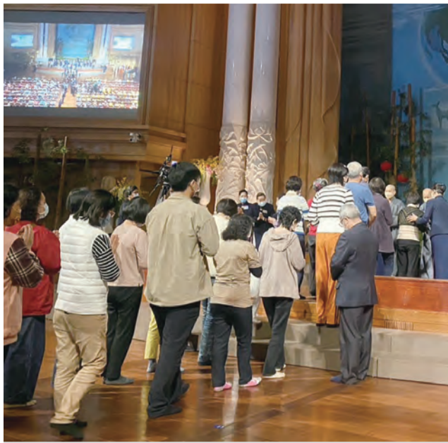
上圖：慈濟在花蓮靜思堂舉行歲末祝福，發送會眾「勤行學與覺，大愛滿人間」福慧紅包。