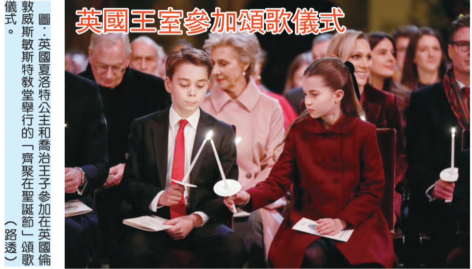
圖：英國夏洛特公主和喬治王子參加在英國倫敦威斯敏斯特教堂舉行的「齊聚在聖誕節」頌歌儀式。