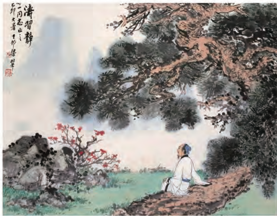
▲只有把喜怒哀樂的開關掌握在自己手中，才能更加從容地愛自己，愛別人。

真正的強者，懂得將人生的音量調至最低，專注於內心的修行。其實所有人的一生，都會永遠面臨兩個課題，一個關於外部，另一個關於自己。我們或許無法左右外界的風雲變幻，但可以主宰自己的內心世界，改變自己。正所謂：「沒有深刻的自我反省，就沒有驚人的自我超越。」未經內求的人生，註定會止步不前。只有戒掉抱怨，反求自身，生活才會打開新的篇章。有些人，面對挫折，選擇向外歸咎，怨天尤人。而有些人，更多選擇內省，用行動去書寫人生的新篇章。所以，內求，才是做人最高的修行。當你開始向內生長，你的人生，才會因此變得豐富而深邃，充滿了無限可能。