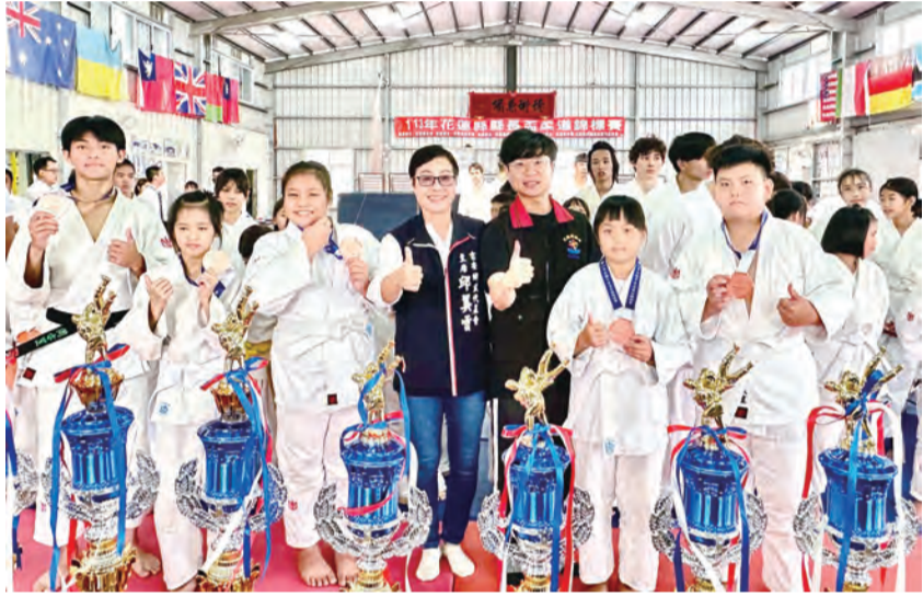
圖：花蓮縣政府十二月六日晚間在花蓮理想大地渡假飯店辦理「一三三年度觀光大使志工服務隊志願服務會暨表揚大會」，會中亦辦理全體志工之志願服務會暨幹部改選，觀光大使出席踴躍，展現出高度凝聚力及向心力。

記者田德財、謝宗璋／綜合報導 時值歲末年終，慈濟在十二月七日於花蓮靜思堂舉行歲末祝福，發送會眾「勤行學與覺，大愛滿人間」福慧紅包，慈濟會員共同敲響愛心鑼，在許願樹上寫上祝福，一起吃平安粥。