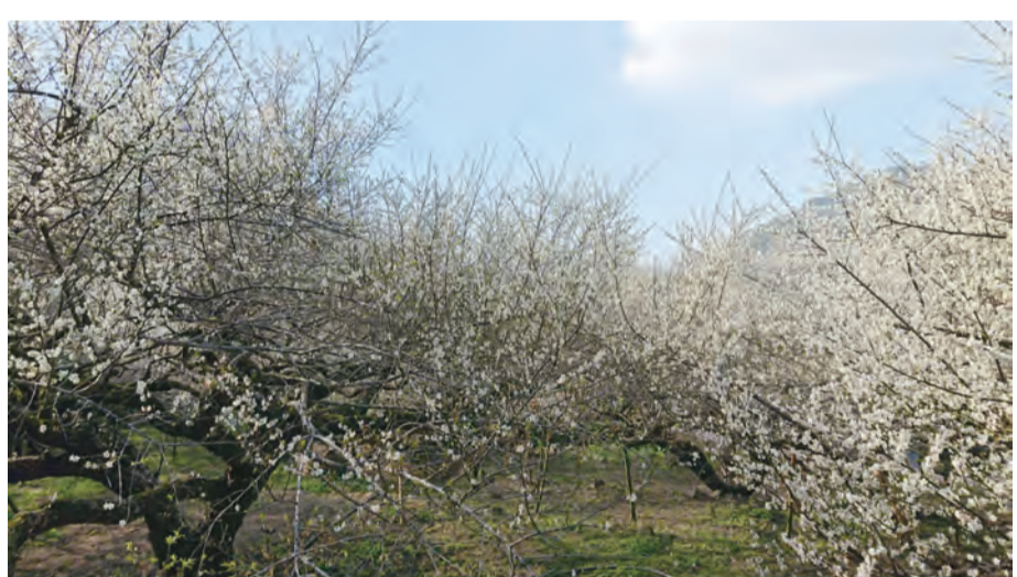
圖：台中市新社區福興里的梅花森林盛開