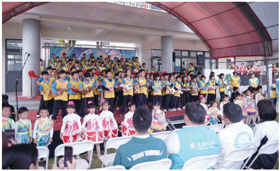
圖：新建花蓮市北濱國小七、日舉行新南側校舍落成典禮。