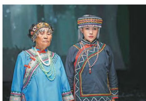
記者蔡宛玲/台北報導