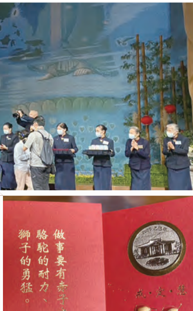
右圖：福慧紅包圖案設計，紀念幣正面是慈濟五十九週年的LOGO和法船。