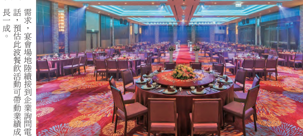
瑞穗天合酒店擁有挑高五米無柱宴會場地，為花蓮地區首屈一指的大型宴會場地。瑞穗天合酒店提供需求，宴會場地陸續接到企業詢問電話，預估此波餐飲活動可帶動業績成長一成。

記者黃萬中/報導 瑞穗天合酒店推出尾牙春酒宴的需求，瑞穗天合酒店即日起推出尾牙春酒宴，每桌一萬元起，假日可選擇每桌一萬二千元或一萬九千元。尾牙春酒宴，是瑞穗天合酒店為犒賞員工辛勞而特別推出，旨在讓員工在歡樂的氣氛中，度過一個愉快的尾牙。瑞穗天合酒店表示，今年的尾牙春酒宴，除了傳統的聚餐外，還特別安排了精彩的表演和抽獎活動，讓員工在歡樂的氣氛中，度過一個愉快的尾牙。 瑞穗天合酒店表示，今年的尾牙春酒宴，除了傳統的聚餐外，還特別安排了精彩的表演和抽獎活動，讓員工在歡樂的氣氛中，度過一個愉快的尾牙。瑞穗天合酒店表示，今年的尾牙春酒宴，除了傳統的聚餐外，還特別安排了精彩的表演和抽獎活動，讓員工在歡樂的氣氛中，度過一個愉快的尾牙。