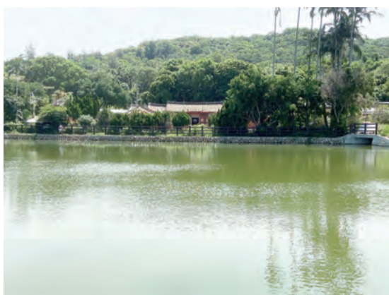
老家前是水池，後是園地山嶺