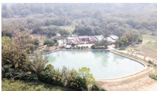
遠眺老家的四週環境