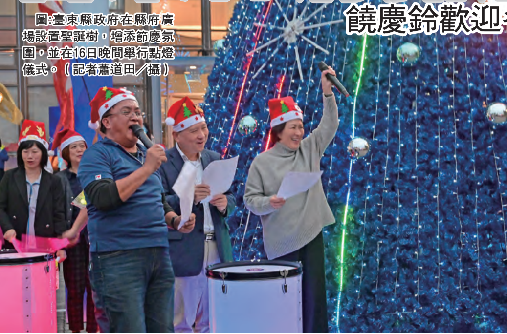
圖：台東縣政府在縣府廣場設置聖誕樹，增添節慶氛圍，並在16日晚間舉行點燈儀式。