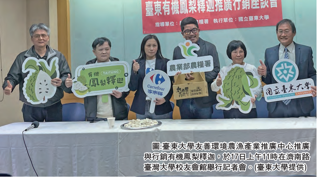
圖：臺東大學善環境農漁產推廣中心推廣與行銷有機鳳梨釋迦，於17日上午11時在濟南路臺灣大學校友會館舉行記者會。

記者蕭道田/報導 台東大學善環境農漁產推廣中心推廣與行銷有機鳳梨釋迦，於17日上午11時在濟南路臺灣大學校友會館舉行記者會，邀請有機鳳梨釋迦農戶、營養保健專家、有機通路商、有機加工廠、小農組織推廣組織及政府主管機關舉行聯合記者會，分享有機鳳梨釋迦鮮果與超微溫急速冷凍產品，敬邀媒體記者朋友參加。 台東大學表示，釋迦的維他命C約蘋果的13倍，維他命B2是1.1倍，鎂是7倍，在武漢肺炎流行初期，英國BBC News在2020年5月公佈，釋迦是上千種植物食材中，營養價值排名第二，在此推薦有機鳳梨釋迦為入冬的必備水果。2021年9月21日，中國以粉介殼蟲為由突然宣布中斷臺灣釋迦的進口，導致鳳梨釋迦價格崩跌。台東大學善環境農漁產推廣中心當年在義美食品的支持下，販售有機鳳梨釋迦，與家樂福公司合作推廣，有機驗證之外，另進行可循環頸雉等保育類產品推廣。