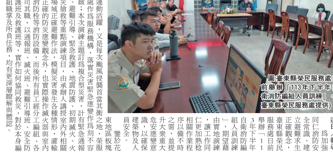
圖：臺東縣榮民服務處日前舉辦「113年下半年自衛消防編組人員訓練」。

記者蕭道田/報導 為加強同仁消防、立避難求生、正確觀念、服務榮民，自衛消防編組人員訓練日前舉辦「113年下半年自衛消防編組人員訓練」，期望藉由實地演練，讓同仁更加熟悉相關作業程序，並提升大眾重大災害應變意識，確保建築物及人員安全。 臺東縣榮民服務處表示，自衛消防編組人員訓練，是每次颱風侵襲首當其衝之地，榮服處作為服務機構，落實災害應變作為刻不容緩；本次演練主題訂為複合型災害，計有緊急通報、避難引導、緊急疏散、地震防護、初期滅火、火災搶救等重點演練項目，由承辦人講授室內外相關正確的防災應變觀念外，也實際操作滅火器與室內消防栓等消防設備，而後所有員工經分工編組，各司其職，以通報、滅火、避難引導、安全維護及救護等，實作如何協同救災，對於本身編組職掌及所負責任，均有更深層瞭解與體認。